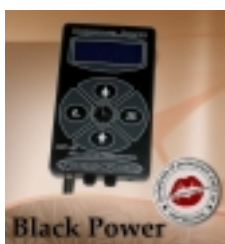
Aparat tattoo 1 800.00 zł

Cyfrowy stabilny aparat do tatuowania. [Szczegółowy produktu...]