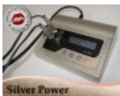
Aparat Silver 1 800.00 zł

Cyfrowy stabilny aparat do tatuowania. [Szczegółowy produktu...]